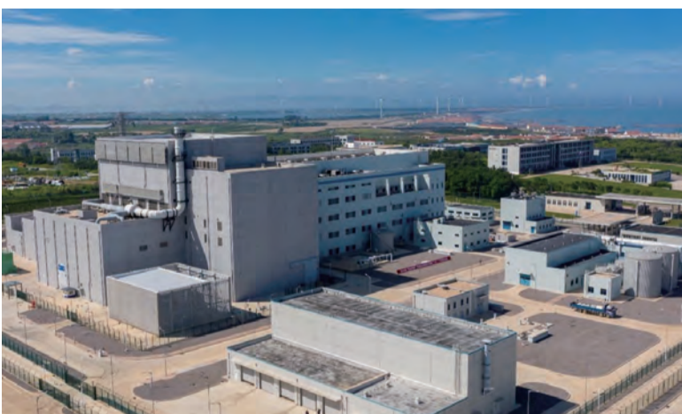
石岛湾高温气冷堆示范核电站

中国核学会将一如既往地支持高温气冷堆技术发展，积极发挥学术交流、科普宣传及国际交流主平台作用，为高温气冷堆科技工作者搭建学术交流平台和国际交流窗口。